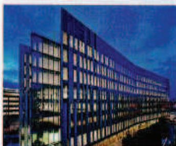
Le projet le plus conséquent : la tour 1 à La Défense.