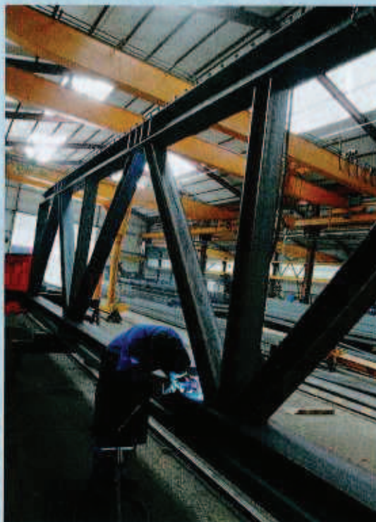
Le plus gros chantier du moment est le futur centre des congrès de Nancy, à côté de la gare, « un marché d'environ 3 millions d'euros et 800 tonnes de charpente ».