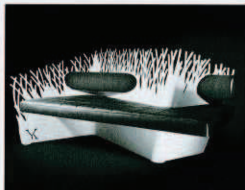
L'entreprise a choisi de se diversifier en produisant du mobilier design, mêlant acier et autres matériaux. Ici, le canapé de la collection Ykebana.