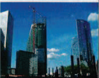
L'entreprise a réalisé un immeuble de bureaux pour Bouygues Immobilier en région parisienne.

SALARIÉS : EFFECTIFS RÉPARTIS SUR DEUX SITES VOSGIENS, DINOZÉ ET RAMBERVILLERS.